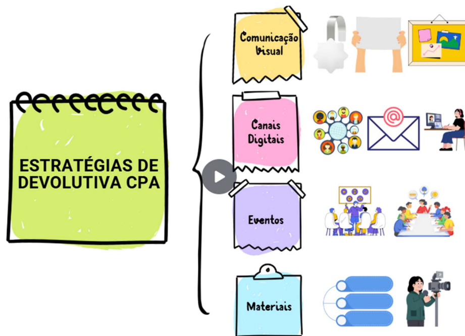
Figura 2: Mapa Mental das Estratégias de Devolutiva da CPA

Essa capilaridade comunicacional permite que diferentes perfis de estudantes recebam a devolutiva de acordo com seus hábitos de consumo de informação. Conforme defende Almeida (2025), a eficácia da devolutiva depende da capacidade da gestão em traduzir relatórios técnicos em mensagens visuais. O uso combinado de mídias físicas e digitais assegura que o ciclo de resposta seja fechado com sucesso. O mapa mental conforme figura 2, detalha as principais frentes de atuação para a consolidação desse ecossistema de transparência.