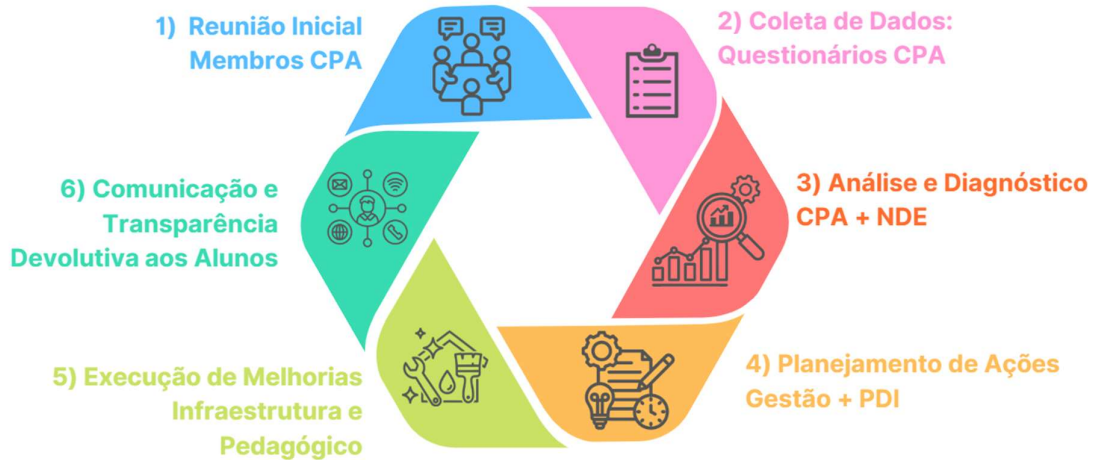
Figura 1: Ciclo de Vida da CPA - Autoavaliação