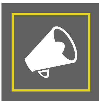
Comunicação Social – Publicidade e Propaganda