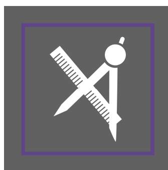
Arquitetura e Urbanismo